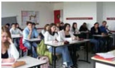
BTS IAA 1 – Le Gros Chêne

« Plus que les diplômes, c'est la motivation qui compte »