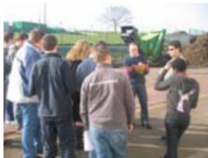
BEPA/Bac pro – Kerlebost en visite à Arvor Compost

Pour avancer : il faut se remettre en cause