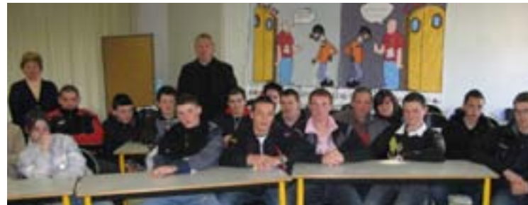
Classe de 3 ème (projet professionnel) - Kerlebost

L'apprentissage : une passerelle vers l'entreprise