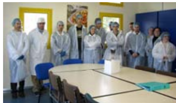
BTS Anabiotec1 – Le Gros Chêne en visite chez Gelagri