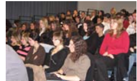
Terminales ES - Jeanne d'Arc

« J'ai noté l'importance du savoir-être dans les entreprises comme arriver à l'heure... »