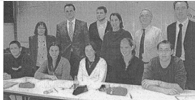
Les organisateurs font partie de l'association E magique. E comme étudiants, enseignants et entreprise.

Le « Printemps de l'entreprise » revient du 17 au 21 mars. Plus de mille étudiants y participeront cette année.