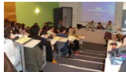
Etudiants 2 ème année – IFSI

« Dans l'entreprise, il est important d'impliquer tous les collaborateurs dans la mise en place de nouvelles démarches de santé au travail »